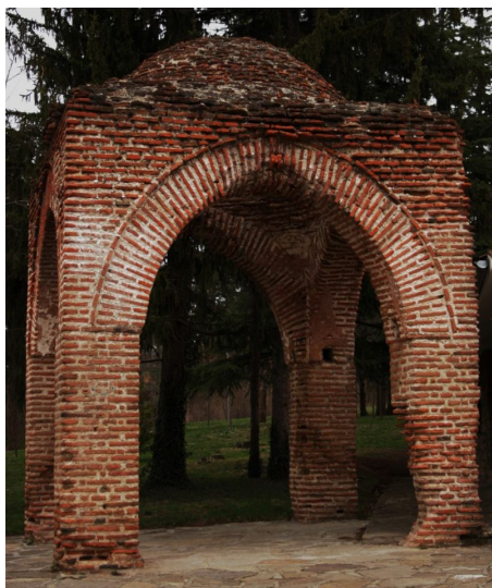
Храм в г. Казанлык, Болгария

Когда храм строили на месте, где находятся геомагнитные центры не только солнца, но и луны, тогда строили его без четырёх колонн внутри, т.е. без символов четырёх космических эфиров. В этих храмах совершались обряды, объединённые связью Солнце-Луна . Они совершались под руководством колобров степени Ворона (8) или колобров-шаманов. Их задача была совершать ритуалы, связанные с естественными процессами природы, как весеннее и осеннее равноденствия и т.д.