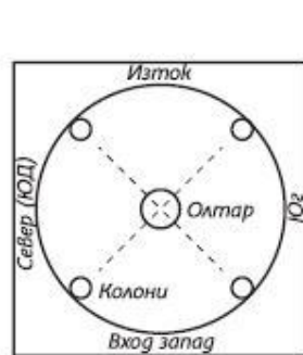
Вид на храм сверху.

План этого первообраза храма, известный болгарам 36 000 лет назад и установленный в нашей Коренной расе скифом Рамом, представлял собой квадрат с вписанным в него кругом. В его центре находилась забитая в землю каменная колонна высоты около 1 метра, а в четырёх углах стояли четыре колонны. Этот план графически изображает Танг РА в планетном теле.